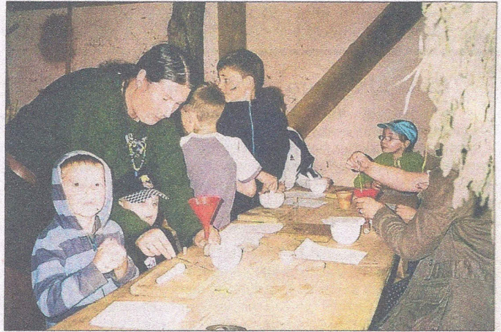
Kita-Kinder beim Herstellen von „Bärlauchsalz“ in der Keltenhütte.